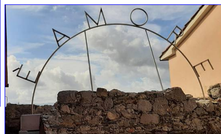
Particolare dell'opera d'arte