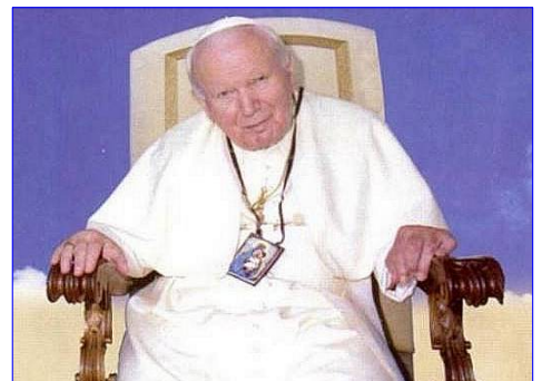
Papa Giovanni Paolo II con lo scapolare