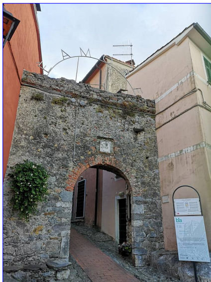
L'opera principale dell'intervento (foto sopra), una scritta arcuata in acciaio

Caro Montemarcello, il progetto che racconta il sentimento d'amore autentico e genuino emerso dalle interviste, parla di questo, di quel senso di comunità e di appartenenza con il proprio borgo, terra del possibile e monumento alla diversità.