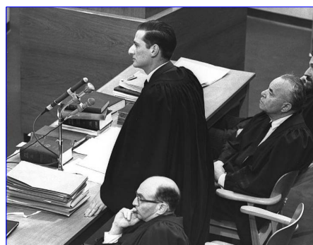
Gabriel Bach (in piedi) al processo contro Adolf Eichmann 1961

Mio padre, Gabriel Bach, è morto tre mesi fa. Da ragazzo è riuscito a fuggire dalla Germania nazista all'ultimo momento. Anni dopo divenne uno dei pubblici ministeri nel processo storico del criminale nazista Adolf Eichmann. In seguito è stato Procuratore Generale e poi Giudice presso la Corte Suprema in Israele. Per tutta la vita ha continuato a re-