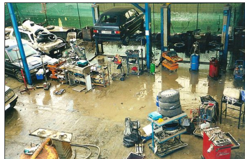
Un momento difficile per l'Officina MC: l'alluvione del 6 novembre 2000 con 1 metro e 60 cm di acqua. Praticamente tutto distrutto ma per fortuna tutto indennizzato. Tanto spavento ma poi tutto superato.

R.: Abbiamo sistemato i locali con l'aiuto di tanti amici e aggiunto una tettoia esterna che ci ha montato mio suocero, fabbro. Il passo successivo è stato quello di cercare i clienti: prima con gli amici di Ameglia che venivano alla 2A e amici d'infanzia o amici degli amici di Marinella dove non c'è nessuna officina poi con il passaparola nei bar o alla