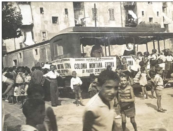
La colonia montana estiva di passo Centocroci

termini quantitativi che qualitativi ed i malati, non raramente, rifiorivano anche se non potevano ancora contare su terapie antibiotiche; ricoverando i malati nei sanatori, si cercava non solo di curarli, ma anche di allontanarli dai contesti famigliari e sociali, ove avrebbero comunque diffuso il contagio.