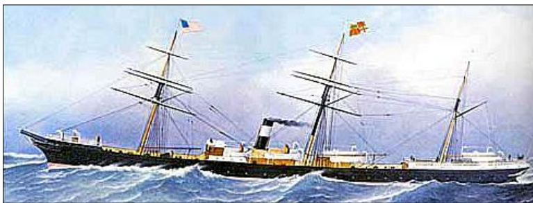
La Vincenzo Florio

Al Matteo Bruzzo fu inibito l'approdo, con l'obbligo di rimanere ai limiti delle acque territoriali, rifornito con viveri, carbone e medicinali, vigilato da un'unità militare pronta sparare.